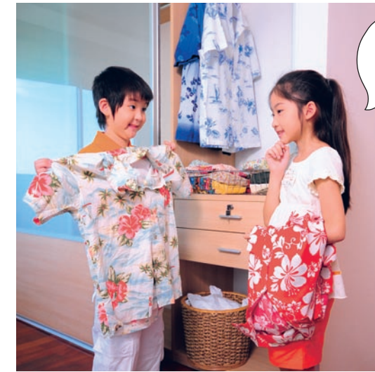
ได้งวตังตงตงตงตง ซักผ้าของนะ

วัยประถมเป็นวัยที่มีความพร้อมรอบด้าน ทำให้การเล่นของเด็กวัยนี้มีความหลากหลาย มีรูปแบบการเล่นของตัวเองที่เขาสามารถคิดริเริ่ม หรือมีความคิดที่แปลกใหม่ซึ่งแตกต่างจากเดิมอยู่ตลอดเวลา มีทักษะในการแก้ปัญหา มีความอิสระในการคิด และหากการเล่นนั้นๆ ได้มีการสื่อสารพูดคุยจะยิ่งส่งเสริมให้เขาได้ใช้ถ้อยคำที่หลากหลาย มีการพัฒนาทางด้านภาษาอีกด้วยค่ะ