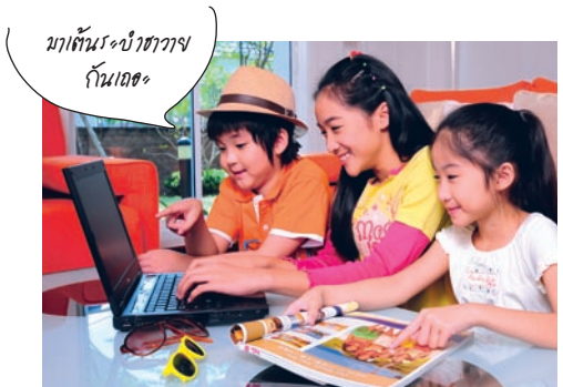
มาค้นหาทางกันเถอะ

การเล่นเป็นงานของเด็ก ที่มีความสำคัญต่อการเรียนรู้รอบด้าน มาดูวิธีการส่งเสริมเรื่องเล่นของลูกให้ทั้งสนุกและส่งเสริมความคิดสร้างสรรค์ สานต่อจากวัยอนุบาลกันค่ะ